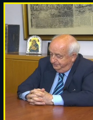
Γ. Κουμπανάκης: Μνήμες από το Ωδείο Αθηνών σελ. 12