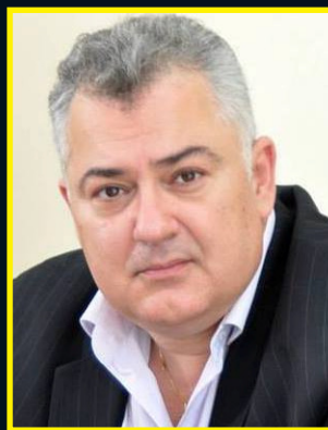
Ρεδιαδης-Τούμπας Ηλίας: «Εκκλησιαστική Μουσική και διδασκαλία» σελ. 4