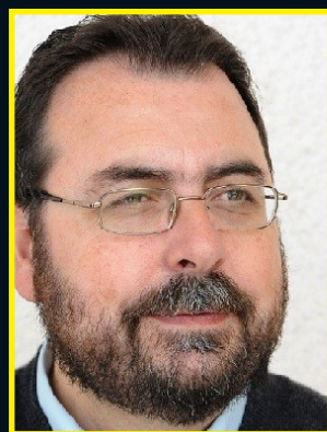
Κωνσταντίνος Χαρίλ. Καραγκούνης: «Η ενόργανη μουσική και η ορθόδοξη λατρεία» σελ. 7