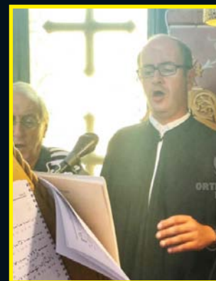
Σπ. Καμίτσης: Αφιέρωμα στον αιμίμηστο Θεολόγο Ερωτέλους σελ. 14